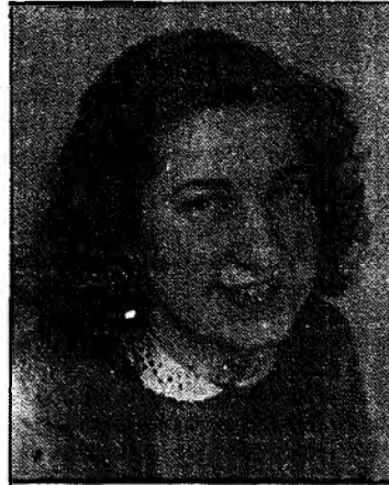
1947, אמסטרדם: חקפת שיקים, שניצולים אתרים לא זכו לה

מה פתאום? "כי ברוונסבריק היו נשים שהניעו לשם מאושוויץ, למשל נשים שגולדו מנישואי תערובת ולא נשלחו להשמדה. והנשים האלה סיפרו מה בריוק נעשה באושוויץ. קציני האס"אס כטרוינשטאט רצו להכטיח שלא נספר תמונות