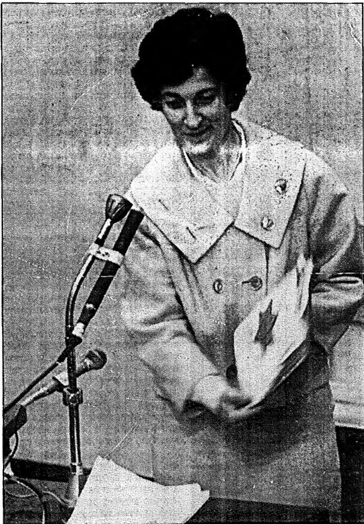
1961, ירושלים: מעירה במשפט אייכמן, 16 שנה לאחר שחקר אותה