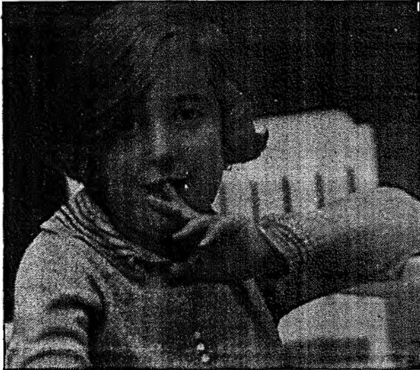
1935, אמסטרדם: לוחת בבית הגדול בהקארט פטראט

"ואני בהחלט קושרת את מה שלמרתי שם, במתנה רוונסבריק, ולפני כן בימי הכיבוש בהולנד, לזה שהקמתי את המוקד להגנת הפרט, אתר עשרות נשים, פה בירושלים המודרנית. ככל חברה קיימת סכנה של הידרדרות לרמה תת-אנושית, לא כמו הגרמנים במתנות ההשמדה אבל לרמה חיתית. גם מדינת ישראל היתה כסיכון כזה. ראינו בחברה שלנו תופעות זווועיות. ההשוואה היא למה שאני קוראת 'התנהגות של ההולנדי המצועע', בימי הכיבוש. מרובך בהולנדים נוצרים, שחיייהם לא היו כסכנה, והם הסתגלו, השלימו, חיו בשקט עם העובדה שלידם מתנהלת השתוללות ופגיעה במיעוטים."