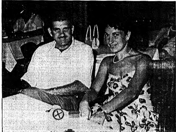
1956, ירושלי: יום לוחת כפי ולצברגו בירת חרבש